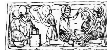
Les batteurs d'argent

11- La maison Duroure : Cette maison fut longtemps la maison de maîtres cordonniers. C'est un très bel exemple de maison d'artisans du 15 ème et du 16 ème siècle.